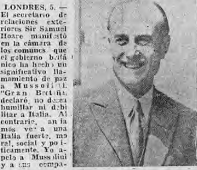
SIR SAMUEL HOARE

LONDRES, 5.—El secretario de relaciones exteriores Sir Samuel Hoare manifestó en la cámara de los comunes que el gobierno británico ha hecho un significativo llamamiento de paz a Mussolini. "Gran Bretaña, declaró, no desea humillar ni debilitar a Italia. Al contrario, a la luz de una Italia fuerte, moral, social y políticamente. Yo apelo a Mussolini y a sus compatriotas para que abandonen la sospecha de que pueda haber motivo siniestro tras de nuestro apoyo a la Liga de Naciones."