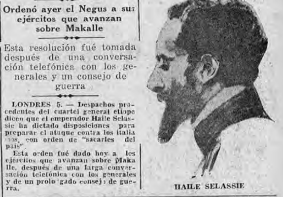
Ordenó ayer el Negus a sus ejércitos que avancen sobre Makalle

Esta resolución fué tomada después de una conversación telefónica con los generales y un consejo de guerra