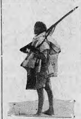
TAMBIEN Etiopia tiene su niño soldado. La fotografía lo muestra preparándose para ir al frente en defensa de su país.

Luego agregó que este apoyo obliga a la Gran Bretaña a realizar la parte que le corresponda en la aplicación del embargo petrolero, cuya eficacia dependerá de los países productores que no son miembros de la Liga.